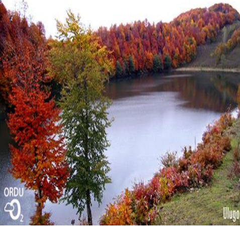
ŞEKİL 1: ULUGÖL

Ordu doğal zenginlikleri, tarihi dokusu, denizi, dereleri, yaylalarıyla dünyanın en güzel köşelerinden biridir. Renklerin bütün tonlarını Ordu'da bulmak mümkündür. Eşsiz koyları, yeşil doğası ve berrak denizi ile kucaklaşmasını görebilirsiniz. Ordu, bölgenin en temiz kumu ve bölgenin en uzun kıyı şeridinde sahiptir. Kıyı şeridinde, birbirinden güzel koylar, doğal ve sağlıklı plajlar ve çeşitli mesire yerleri mevcuttur. Gölköy ilçe merkezine 17 km mesafede bulunan krater gölü Ulugöl , Perşembe ilçesinde bulunan ve Tepeli karabatakların yurdumuzda yuva yaptığı tek yer olarak bilinen Hoynat Adası , Ünye - Niksar karayolunun 7. kilometresinde yolun solunda kalan ve 2500 yıllık bir kale olan Ünye Kalesi şehrin görülmeye değer tarihi ve doğal güzellikleri arasında yer almaktadır. Ayrıca Şehrin simgesi haline gelen ve denizden 450 m yüksekte olan Boztepe 'den şehri seyredebilirsiniz.