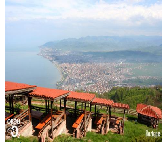
ŞEKİL 4: BOZTEPE