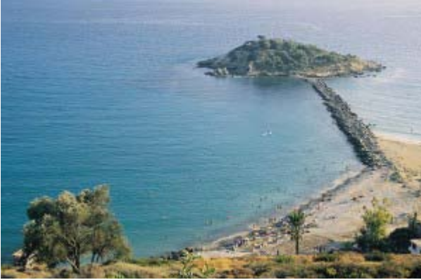
Şekil 1- NAGİDOS ADASI-BOZYAZI

Anamur adını; ANEMURİUM antik kentinden almıştır. Latince olan ANEMURİUM kelimesini açıklarsak, Anem: Burun, Ourium: Rüzgâr anlamına gelir ve yaz sıcaklığında bile rüzgârın hiç kesilmediği bu kente "Rüzgârlı Burun" denilir.