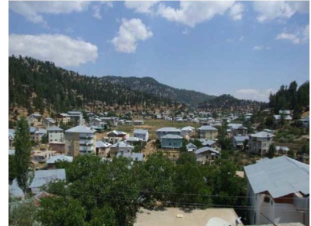
Şekil 6- ANAMUR YAYLALARI