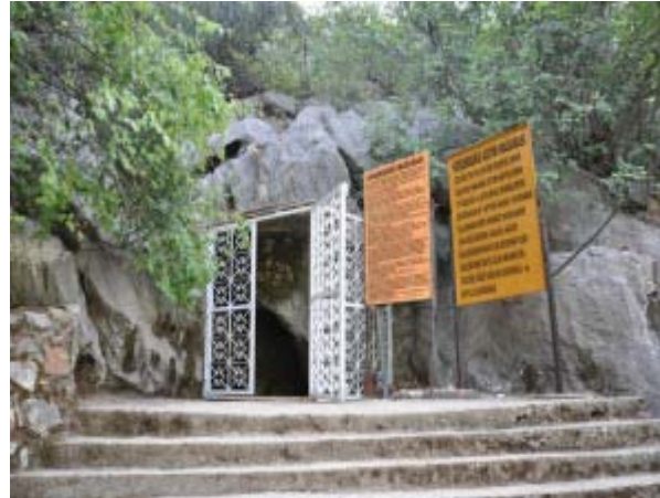
Şekil 5- KÖŞEKBÜKÜ MAĞARASI-ANAMUR