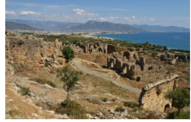
Şekil 3- ANEMURION ANTİK KENTİ-ANAMUR