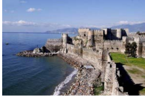
Şekil 2- MAMURE KALESİ-ANAMUR