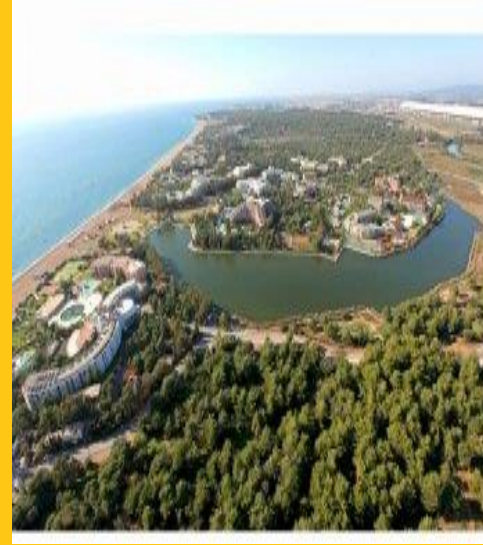
Sorgun Forest - Titreyengöl